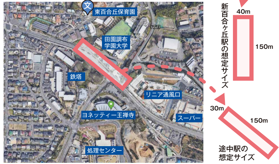
駅的位置はイメージ

結節機能の強化等による川崎市北部地域の公共交通ネットワークの充実とともに、周辺の住環境に配慮しながら、地域資源の活用等による賑わいの創出など、駅周辺の活性化に資するまちづくりを進めます。